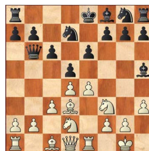
Van Bunderen Gert – Van Weert Bruno Wit heeft zojuist 9.Tf1-e1 gespeeld, er volgde: 9..., c5? 10.e4xd5 en wit won een pion met een betere stelling en verzilverde dit op zet 25 met winst en veroverde zo de kampioenstitel.