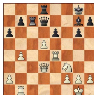
Van Bunderen Gert – Knabe Johan 24. ...., Te8-d8 25. Te4xe6?? en even later 0 – 1

Hieronder 2 cruciale momenten uit de voorbije competitie: